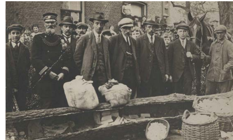
De smokkelvangst van chocolade in een holle boomstam. Deze vangst werd ontdekt op de toenmalige veerpont 'Op Hoop van Zegen' tussen Druten – Ochten.

De naam Oude Dijk herinnert aan de functie die deze weg heeft gekend. De kolken herinneren aan de overstromingen die in dit gebied hebben plaatsgevonden.