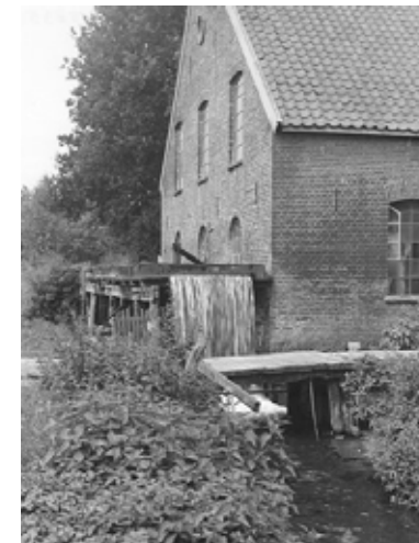
Sprengen en Beken

energie te leveren voor het aandrijven van watermolens. Het merendeel van de sprengen is aangelegd in de 16e en 17e eeuw toen de Veluwse papierindustrie belangrijk begon te worden.