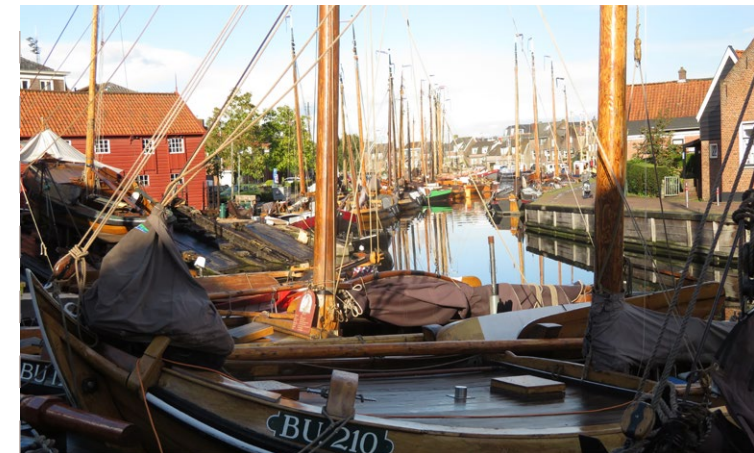
De Oude Haven

Het grondgebied van de gemeente Bunschoten lag in de Grebbelinie. Deze verdedigingslinie loopt van Rhenen tot Bunschoten-Spakenburg. Door de zeesluis bij Spakenburg te sluiten en water vanuit de Nederrijn in te laten kwam het land langs de hele linie onder water te staan, zoals de Bunschoter Kom. In de omgeving lagen verschillende verdedigingswerken ter bescherming van de zeesluis. Ten oosten van het dorp lag bijvoorbeeld een Spaanse redoute, een omwalde