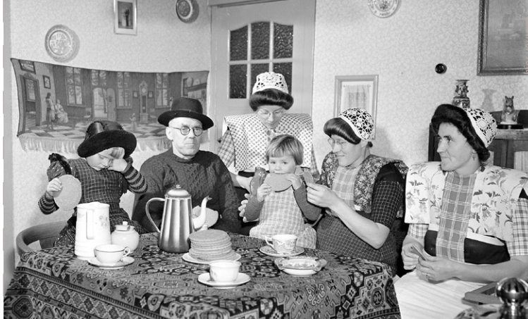
Het ontbijt is niet compleet zonder plak

bisschop van Utrecht. Het uitbreidingsplan werd niet uitgevoerd, de Stadsweiden zijn tot op de dag van vandaag behouden gebleven.