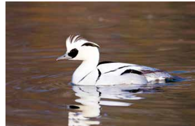
Het nonnetje is een wintergast, die in de polder te zien is

De Loenensche Buitenpolder is voornamelijk eigendom van Staatsbosbeheer en wordt ook grotendeels door hen beheerd. In 2019 onderging dit stukje uiterwaarde een ware metamorfose. Door het verbreden en verdiepen van een oude rivierstrang is de rivierdynamiek binnen de polder hersteld. Het landschap beweegt nu mee met het ritme van de rivier, wat zorgt voor een gevarieerd decor van moeras, bloemrijke graslanden, open weidegebieden en cultuurgrond. De Loenensche Buitenpolder maakt deel uit van het Natura 2000-netwerk, een Europees netwerk van beschermde natuurgebieden. Hier staat de bescherming van kwetsbare soorten en leefgebieden centraal. Dankzij deze status wordt de bijzondere natuur hier extra goed beschermd en kunnen dieren zoals de bever, het icarusblauwtje (zie voorkant folder), watervogels en zeldzame planten hier floreren.