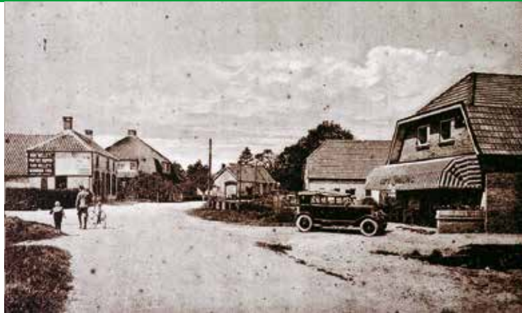
Tielsestraat in Andelst