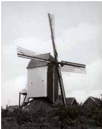
Molen De Vink in Herveld