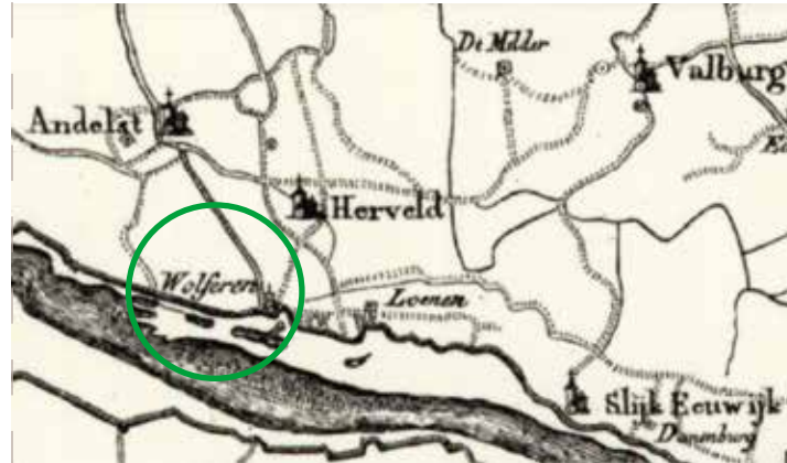
Op deze kaart uit begin 19de eeuw staat nog een kerk ter hoogte van Wolferen